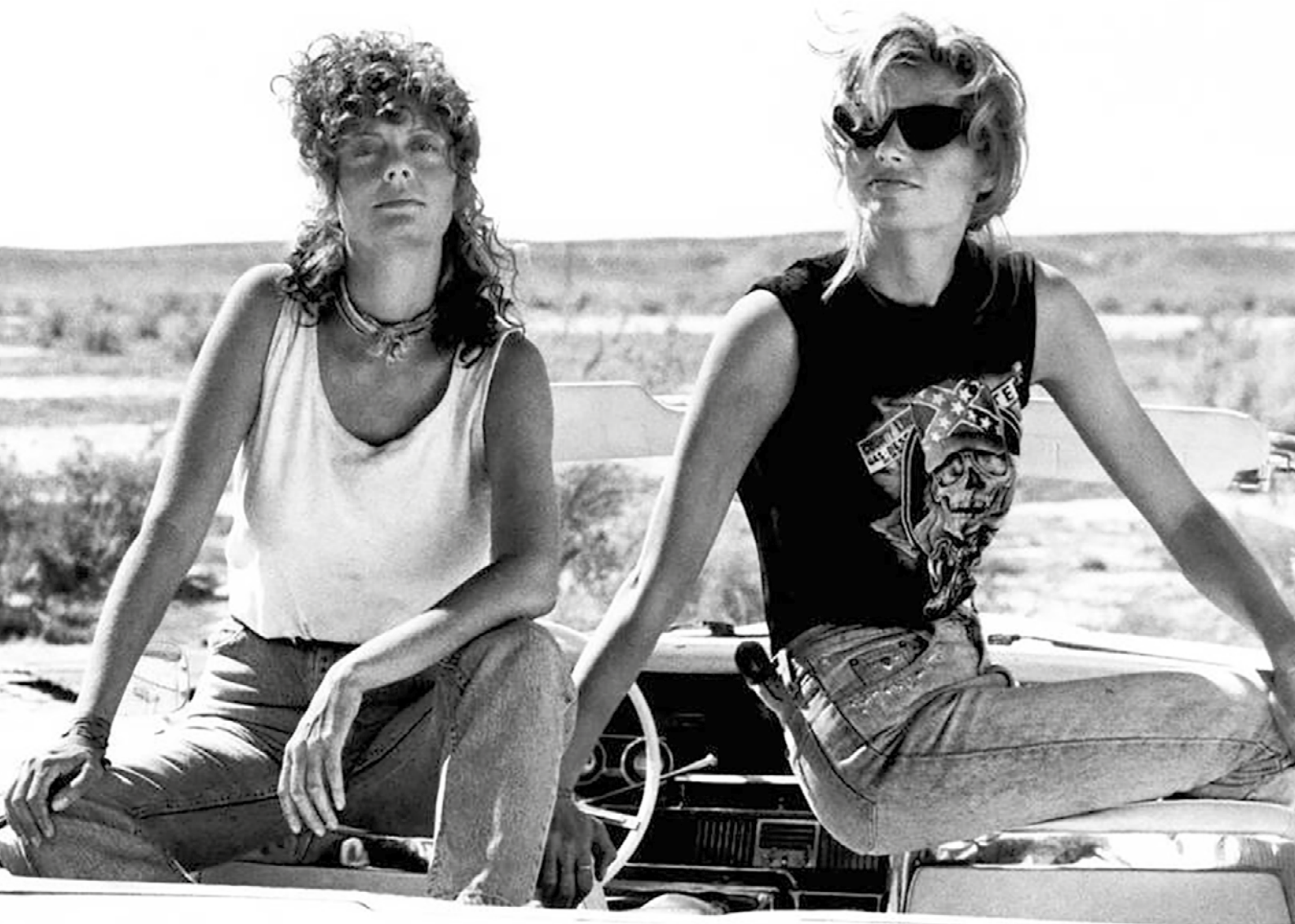
THELMA ET LOUISE de Ridley Scott

Passeurs d'images : la saison des Plein air est lancée !